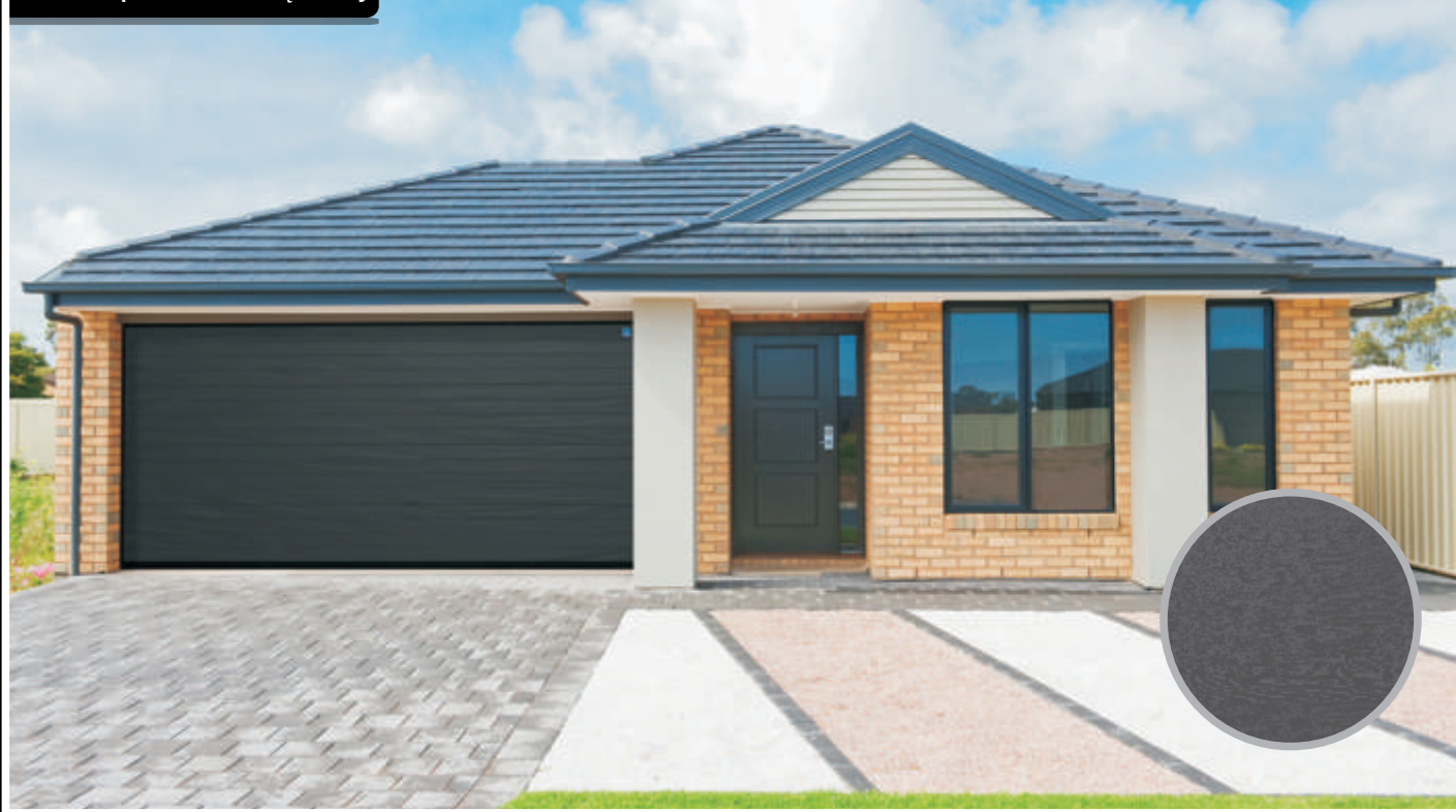
Nice Simple Classic - Brąz Szary

Nice Classic Silk – wąskie przetłoczenia poziome to wyjątkowo uniwersalne rozwiązanie. Idealnie komponuje się zarówno z nowoczesną, jak i klasyczną architekturą domu.