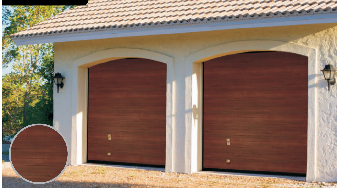
Nice Classic Silk - Siena Rosso

Nice Classic Silk – wąskie przetłoczenia poziome to wyjątkowo uniwersalne rozwiązanie. Idealnie komponuje się zarówno z nowoczesną, jak i klasyczną architekturą domu.